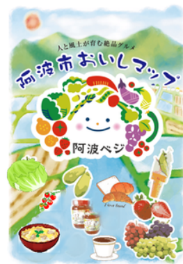
阿波市食マップ 旧デザイン表紙